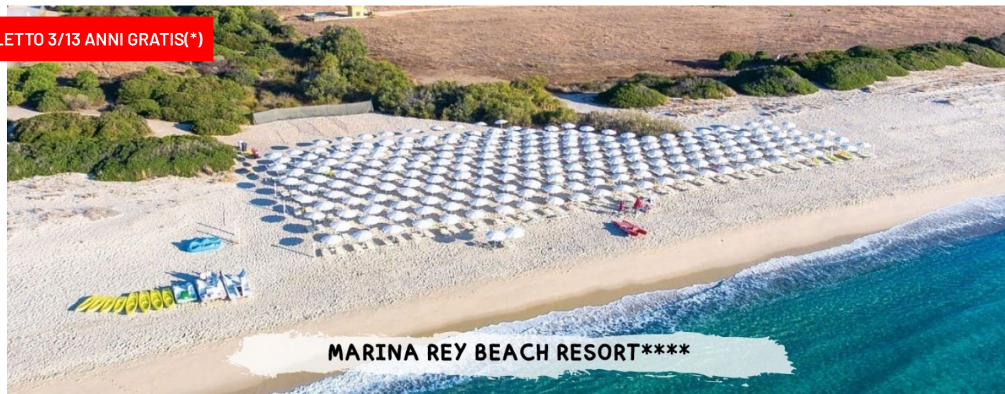
MARINA REY BEACH RESORT****

quote a persona in pensione completa bevande incluse ai pasti