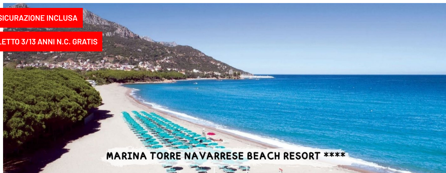
MARINA TORRE NAVARRESE BEACH RESORT ****