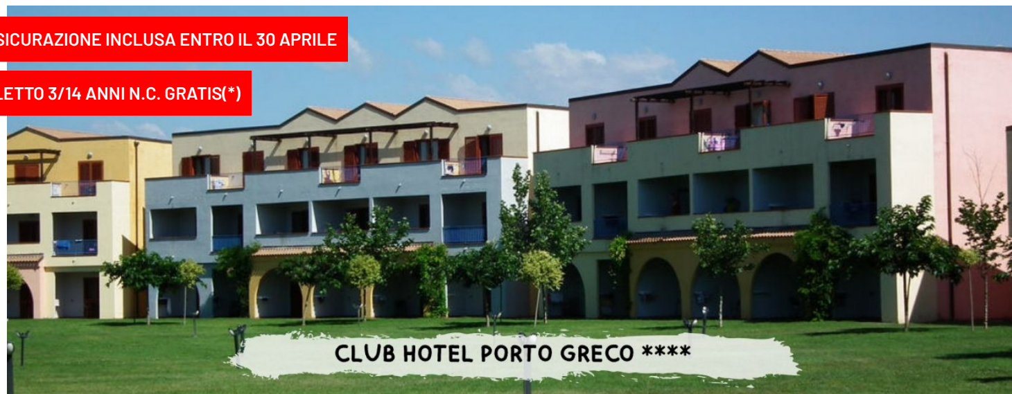
CLUB HOTEL PORTO GRECO ****

quote a persona in pensione completa - bevande incluse in formula "mondotondo club"